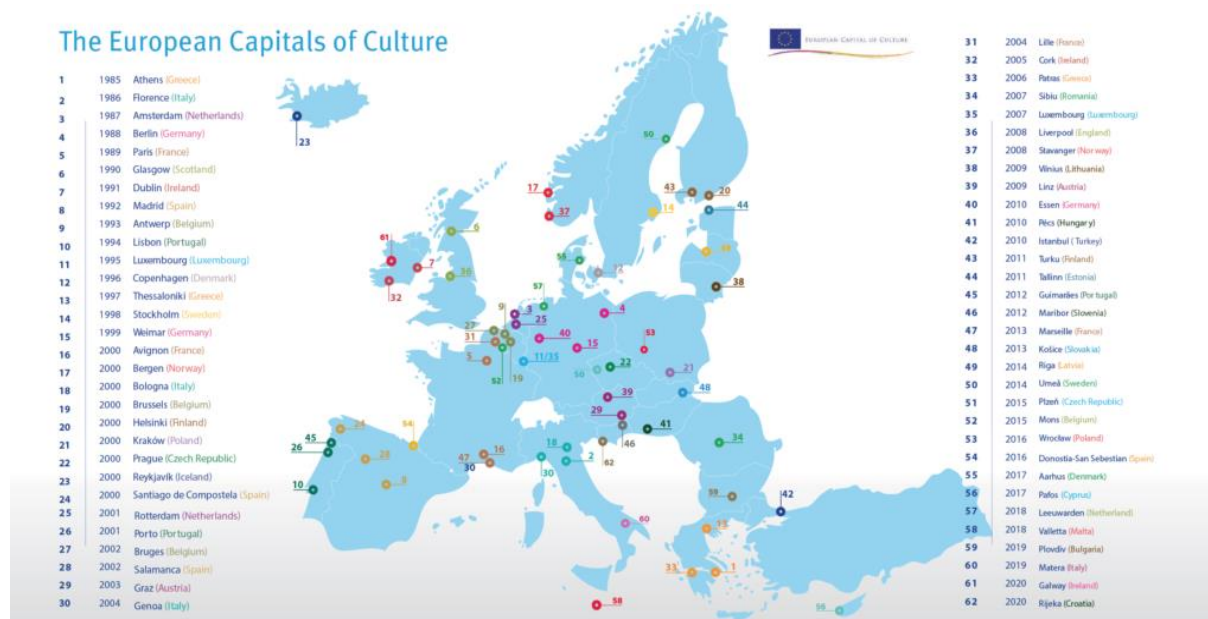
Figura 1. Le capitali europee della cultura, 1985-2020

Nel tempo, la consapevolezza dell'ingente patrimonio storico, artistico e naturalistico della città si fece strada non solo tra l'opinione pubblica ma anche tra le istituzioni. Nel 1986, infatti, venne promulgata la legge speciale n.771 che prevedeva un ingente finanziamento per il risanamento e il restauro di Matera 3 . Infine, nel 1993, i Sassi e le chiese rupestri vennero inclusi nella lista del Patrimonio mondiale dell'umanità dell'Unesco 4 . Grazie a una straordinaria azione di rigenerazione territoriale e urbana, Matera è oggi una delle città d'arte più belle e tra le principali mete turistiche del Sud Italia. Ciò ha contribuito alla sua nomina a ECoC 2019.